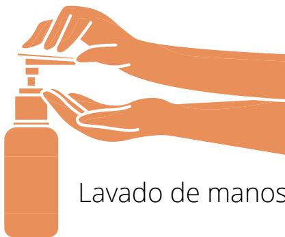
Lavado de manos

Para la prevención del contagio del COVID-19