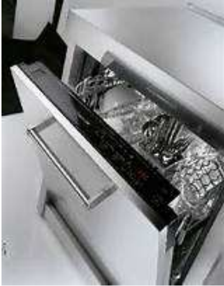
מדריח כלים לפני סגירה