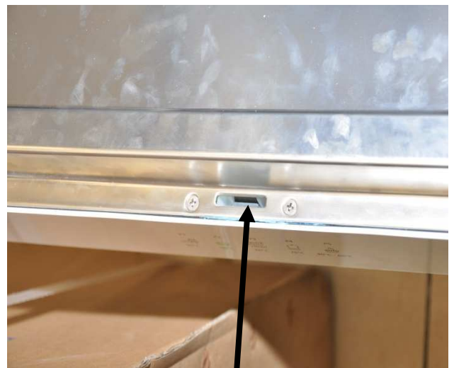
השקע לכניסת פיץ אבטחה