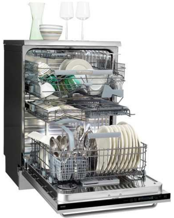
מדריח כלים פתוח