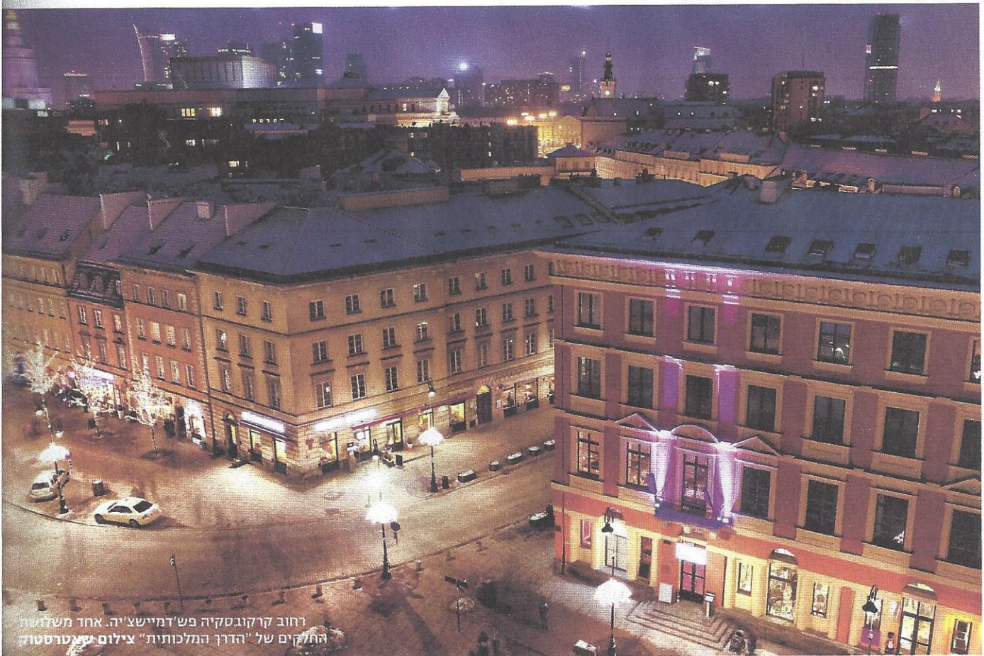
רחוב קרקובסקיה פש'דמיישצ'יה. אחד משלושת החלקים של "הדרך המלכותית"