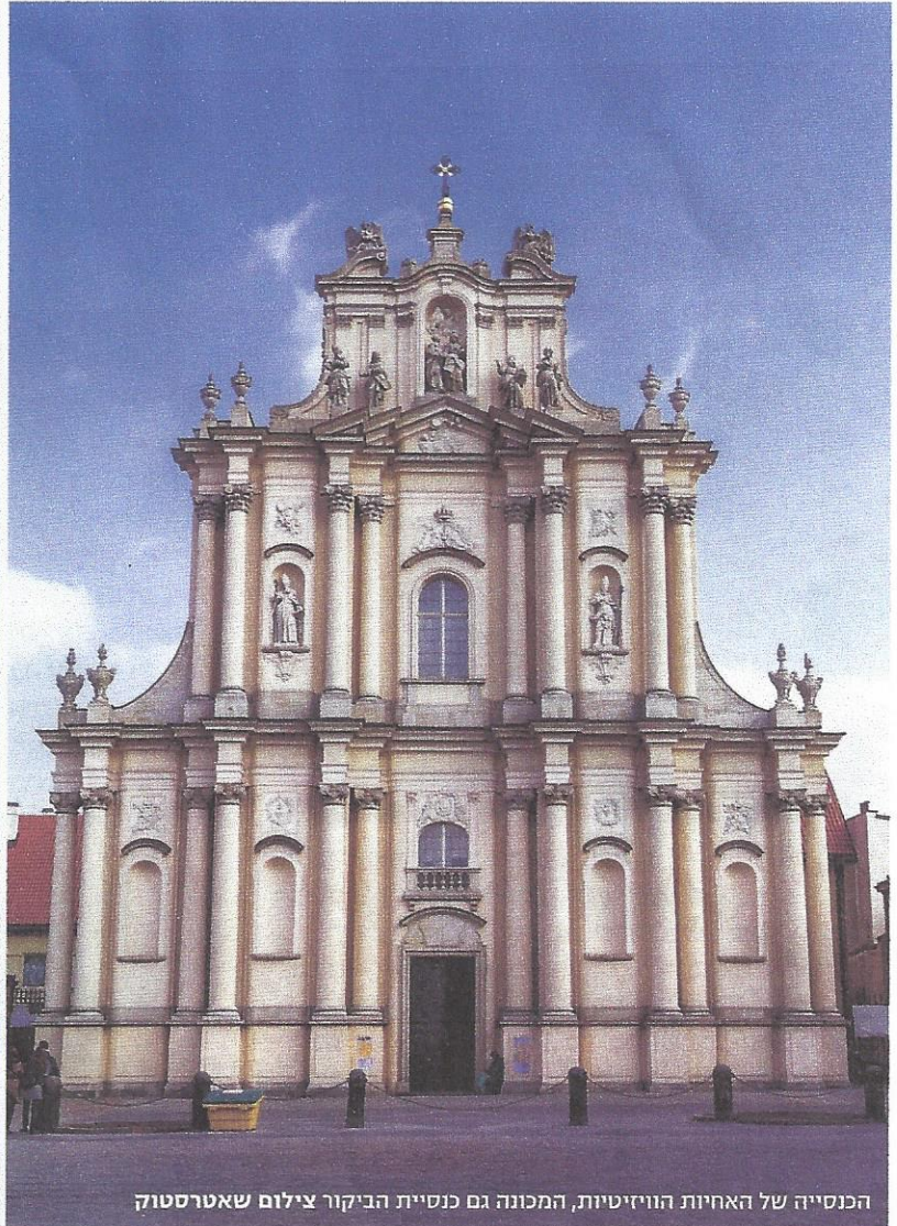
הכנסייה של האחיות הוויזיטיות, המכונה גם כנסיית הביקור

במבנה מודרני שהוקם בשנת 2002 ברחוב דוברה (Dobra). על גג מבנה הספרייה נשתל גן בוטני ממנו אפשר להשקיף מטה לאולמות הקריאה, אך גם על נהר הוויסלה וגשריו. המבנה היא יצירה ארכיטקטונית מדהימה ומבקרים בו למעלה ממיליון איש בשנה. קצרה היריעה מלהזכיר את כל הארמונות והכנסיות שברחוב ולכן, לסיום, אסתפק באזכורה של כנסיית הצלב הקדוש בבית מספר 3, ולו בזכות העובדה שבעמודיה קבורים לבו של המלחין שופן (גופתו קבורה בבית הקברות פר לאשז שבפריז) ולבו של ריימונט חתן פרס נובל לספרות ב־1924.