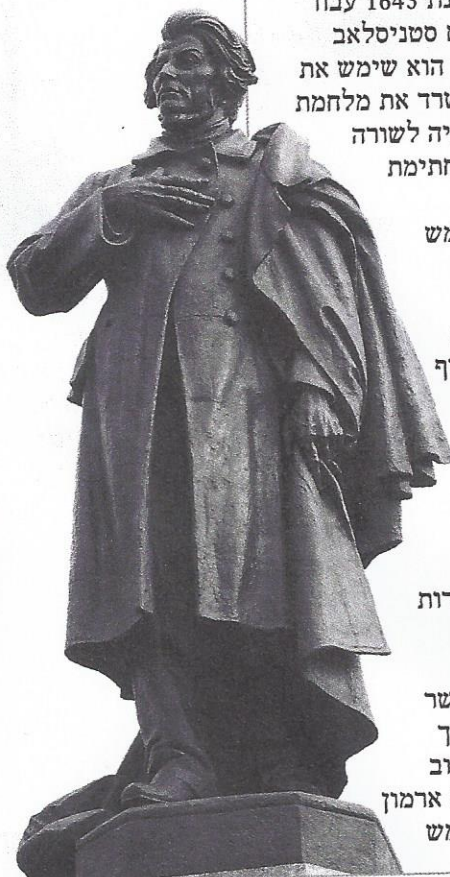
האנדרטה של המשורר הלאומי אדם מיצקביץ'

לאחר ששבענו, נחזור שוב לגדה המזרחית של הרחוב. המבנה המרשים הבא הוא ארמון ראדיזיביל (Radziwiłł Palace), מכונה גם הארמון הנשיאותי) במספר 48/50. הארמון נבנה בשנת 1643 עבור מפקד צבא בכיר ("הטמאן") בשם סטניסלאב קונייצפולסקי. בסוף המאה ה-18 הוא שימש את נציגו של הצאר הרוסי. הארמון שרד את מלחמת העולם השנייה ומאז שימש אכסניה לשורה ארוכה של אירועים פוליטיים (מחתמת הסכמים בינלאומיים ועד הקמת מפלגות). מאז 1994 הארמון משמש למגוריו של נשיא פולין. בחזית הארמון פסלי אריות ופסל ענק של יוזף פוניאטובסקי, שהיה אחיינו של מלך פולין האחרון. יוזף פוניאטובסקי היה המרשל הלא צרפתי היחיד בצבא נפוליאון, ונפל בקרב לייפציג. אפשר להבחין בחייל אחד או יותר ששומרים על ארמון הנשיא, ומכאן גם יוצאים החיילים בשעה 12 בצהריים לטקס החלפת המשמרות בקבר החייל האלמוני, שממוקם מתחת לקשתות ששרדו מהארמון שבגן סקסוני (Ogród Saski). כאשר מתקיימות הפגנות הן מגיעות בדרך כלל לחזית הארמון, ואז נסגר הרחוב כולו לתנועת רכבים. ממול ממוקם ארמון פוטוצקי (Potocki Palace) שמשמש