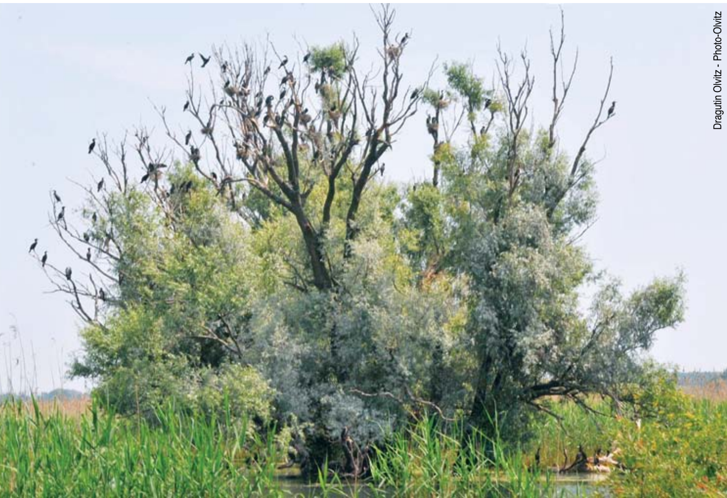
Dragutin Olvitz - Photo-Olvitz