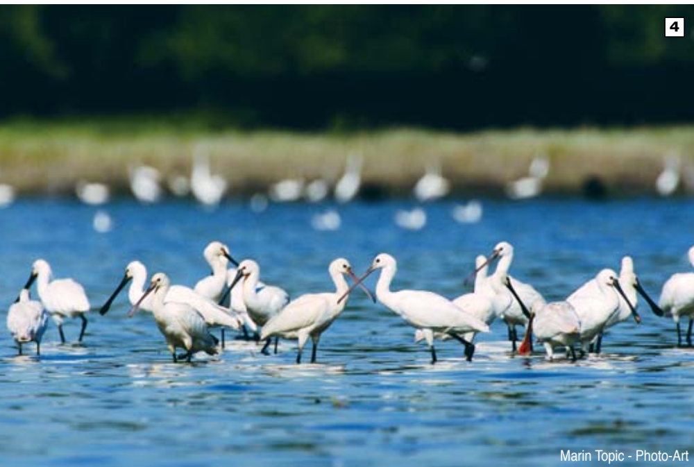
Marin Topic - Photo-Art

בתקופת הנדידה ניתן לאתר כאן כ-70,000 עופות מ-250 מינים. הביצות, המכוסות בחלקים ניכרים בצמחיית מים טיפוסית