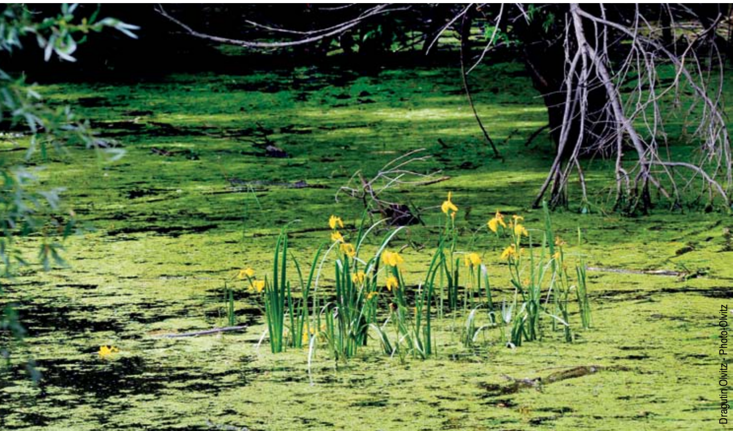
Dragutin Olvitz - Photo-Olvitz