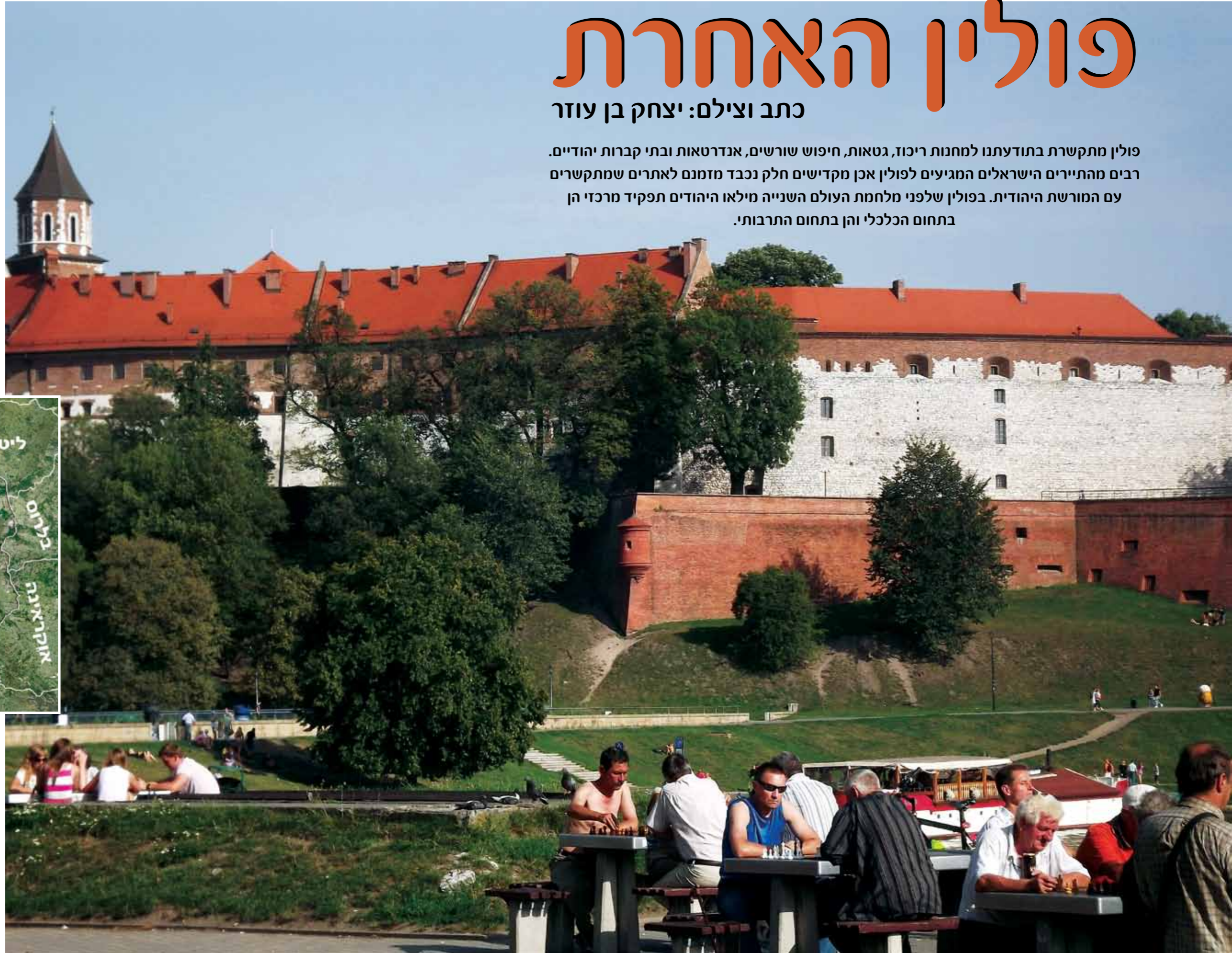
1. משחקים שחמט ונהנים מהשמש המלטפת ברחבה לגדת הויסלה כשברקע גבעת ואוול.