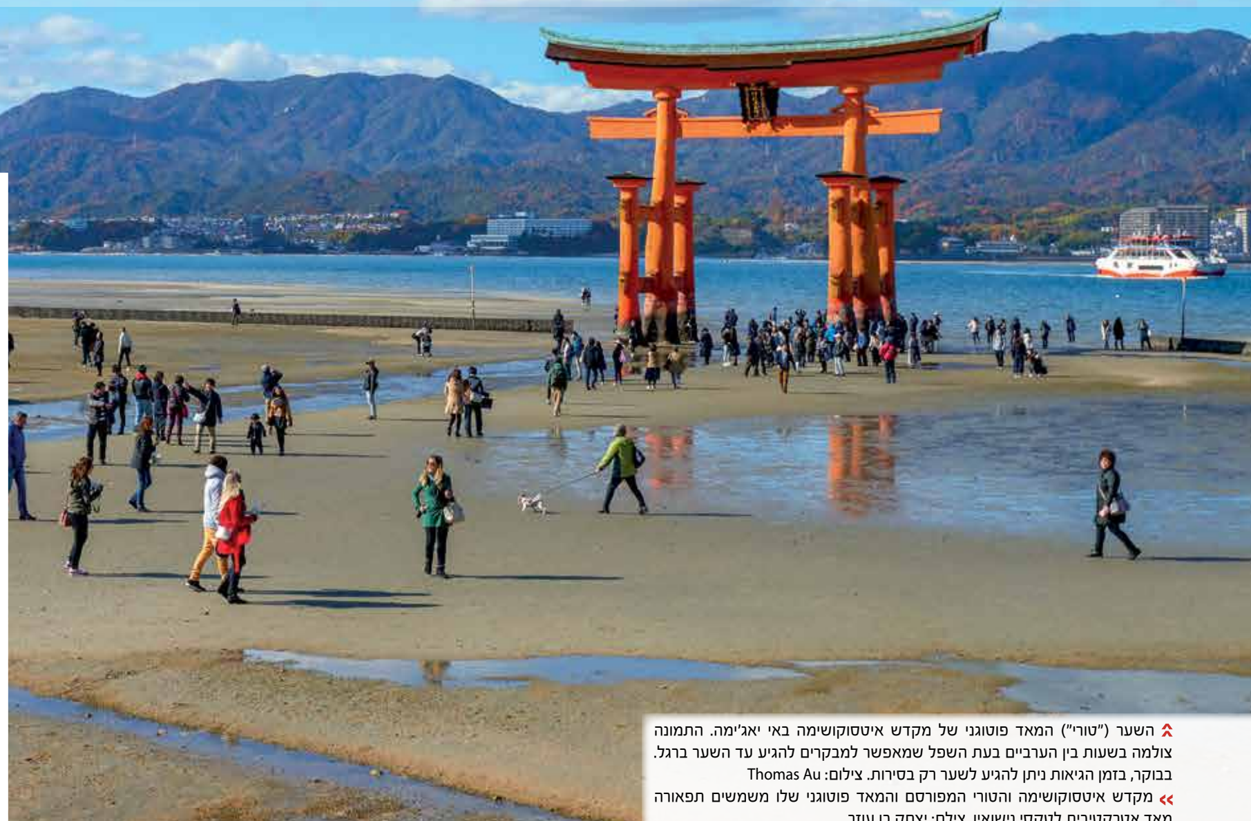
▲ השער ("טורי") המאד פוטוגני של מקדש איטסוקושימה באי יאג'ימה. התמונה צולמה בשעות בין הערביים בעת השפל שמאפשר למבקרים להגיע עד השער ברגל. בבוקר, בזמן הגאות ניתן להגיע לשער רק בסירות. ◀◀ מקדש איטסוקושימה והטורי המפורסם והמאד פוטוגני שלו משמשים תפאורה מאד אטרקטיבית לטקסי נישואין.