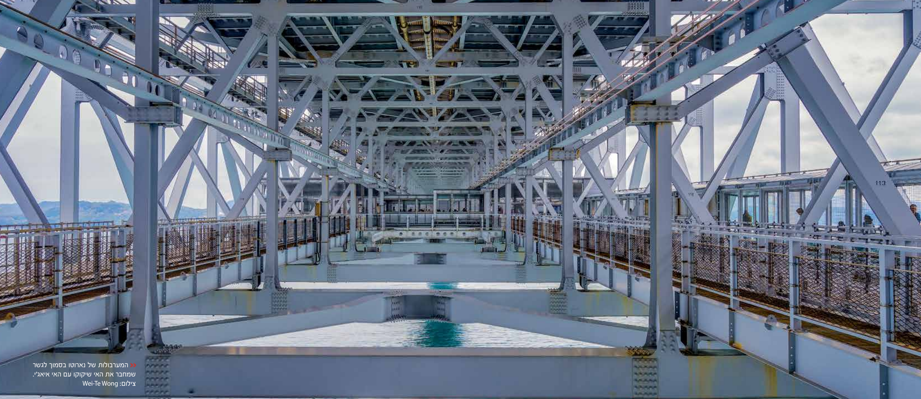
» המערבולות של נארוטו בסמוך לגשר שמחבר את האי שיקוקו עם האי איאג'י.

הנוכחים בשנת 1745. בשנת 1875 הוא הפך לגן ציבורי, ובשנת 1953 קיבל הכרה ממשלתית יפן כאחד הגנים הפורחים היפים ביותר ביפן. בכל עונה פורחים הפרחים של אותה עונה. בחודש אפריל שבו ביקרתי בגנים הייתה פריחה של ויסטריה. בתוך הגן יש שש בריכות ו-13 גבעות. הבריכות מחוברות ביניהן בתעלות, והפוסעים בגן עוברים על גשרים שנבנו מעל התעלות. מעבר לקיוסקים שבפינות השונות של הגן ניתן למצוא כאן גם שני בתי תה.