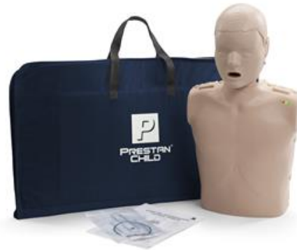
Child Manikin CPR Training PP-CM-100M