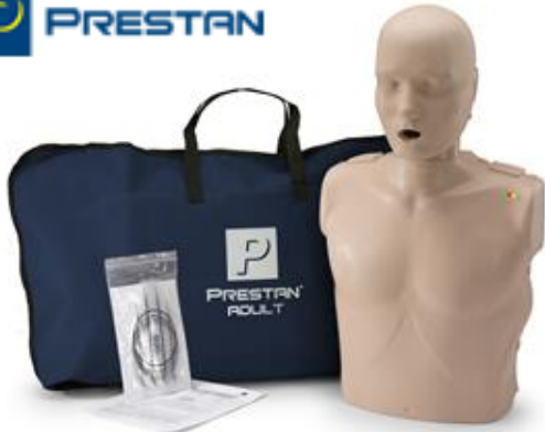
Adult Manikin CPR Training PP-AM-100M