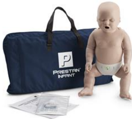
Infant Manikin CPR Training PP-IM-100M