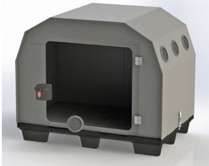
für 1 Hund