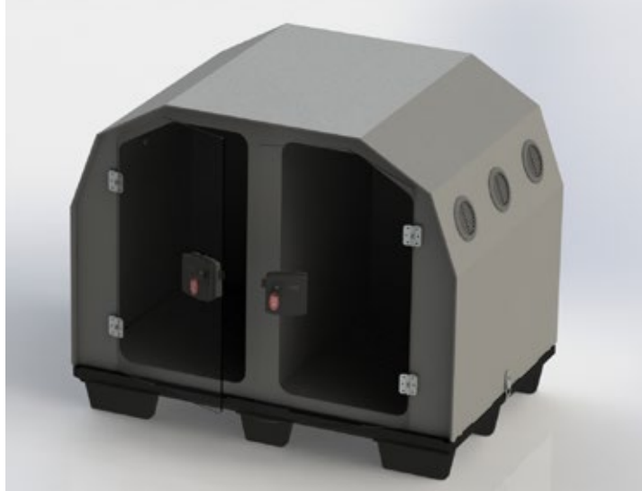
für 2 Hunde