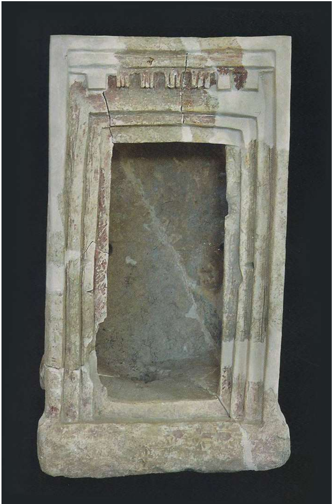
גם מקדש מגולף באבן גיר, במבט חזיתי. מעל לפתח נראות קורות הגג (טרלגיפיס). הפתח מודגש על ידי נסיגת המשקופים פנימה שלוש פעמים. על כל המבנה נראים שרידי צבע אדום