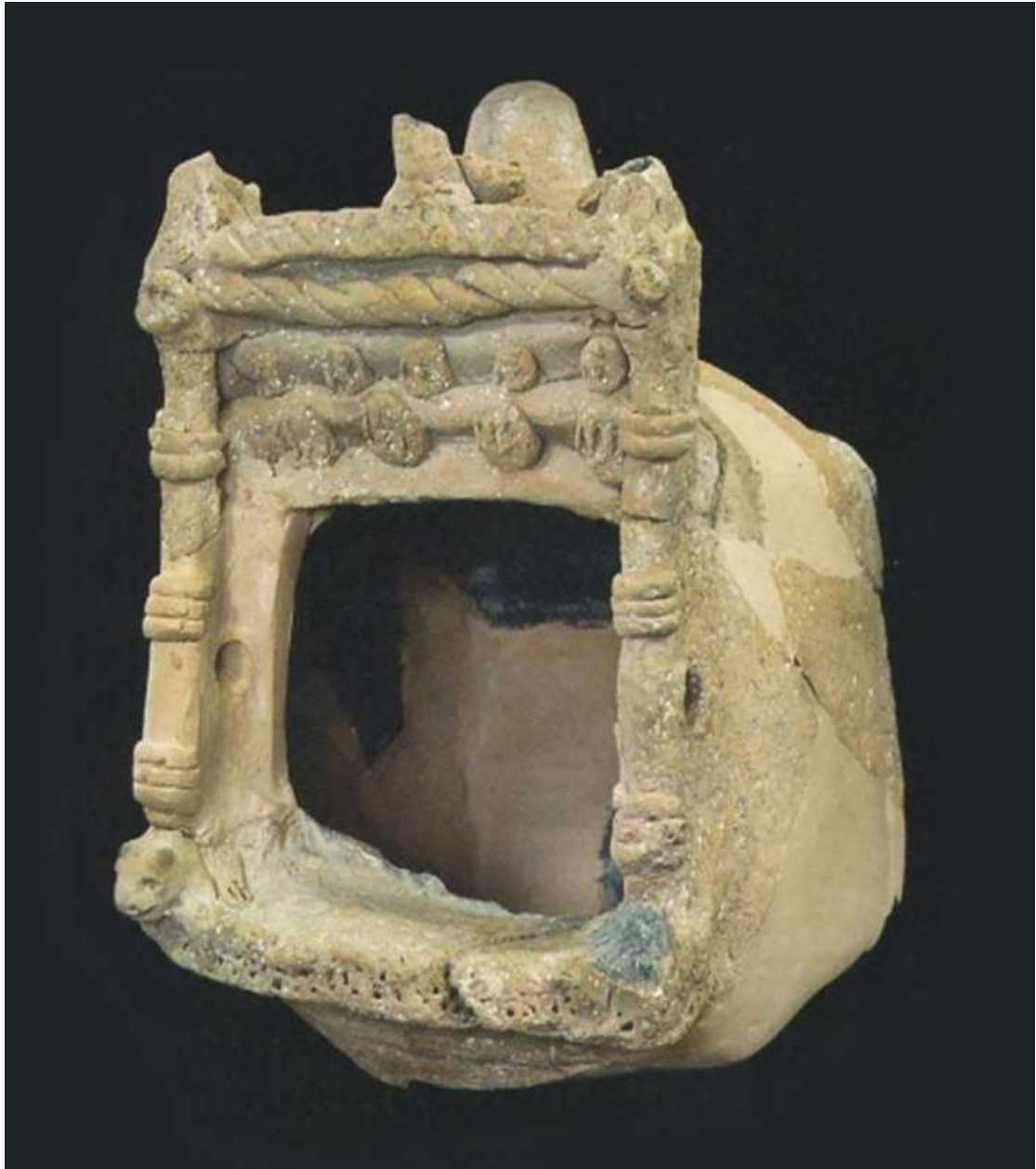
דגם מקדש מעוטר, מחרס, שהתגלה בעונת 2011. הפריט נמצא מרוסק לעשרות שברים שונים. החלק החשוב השתמר במצב טוב יחסית וכולל פתח המעוטר בשני אריות, עמודים, חבלים הקשורים לעמודים, קורות גג, פרכת מגולגלת, עיגולים מחורצים ושלוש ציפורים על הגג