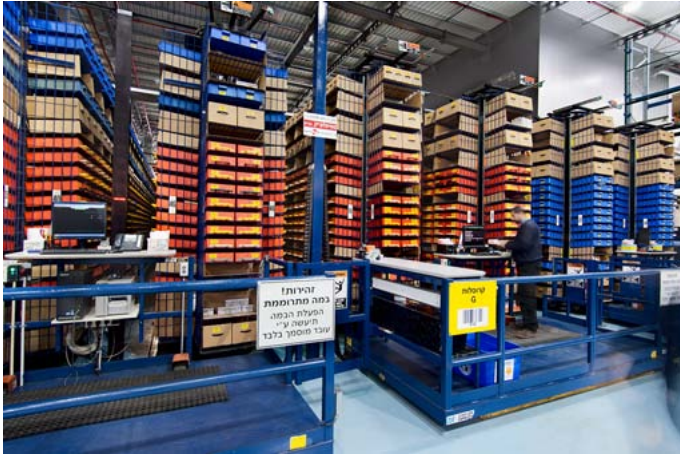
מערכת אוטומטית למחצה לאחסון פריטים קטנים מאוד

מונחים על עגלות שינוע, ובתום הליקוט הן מועברות למחלקת האריזה והכנת המשלוחים.