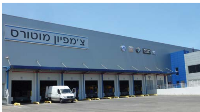
אזור העמסת הסחורה

מקלחות ועם תאי אחסון אישיים ("לוקרים") לרווחת העובדים.