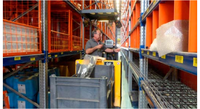
ליקוט בגובה נמוך

"התכנון המדוקדק של תשתיות המרלו"ג, של אמצעיו ושל תהליכי העבודה, וצורת ניהול העבודה ובקרתה מאפשרים לנו, מחד, לספק שירות לוגיסטי ברמה גבוהה מאוד, ומאידך, להבטיח את בטיחות העובדים ולספק להם סביבה ידידותית ונעימה ביותר"