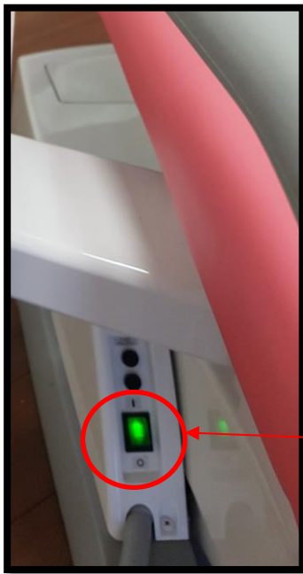
מפסק הפעלה לכיסא בלבד