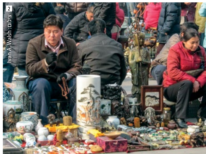
צילום: Ivan A. Walsh 2

1, 2. שוק הפשפשים Panjiayuan נמצא בסמוך לתחנת הרכבת התחתית הנושאת אותו שם. 3. מצפון לבייג'ינג נמצא אתר התיירות המפורסם ביותר בסין - החומה הסינית. החומה אינה מקיפה שום דבר ואינה סוגרת שום מקום.