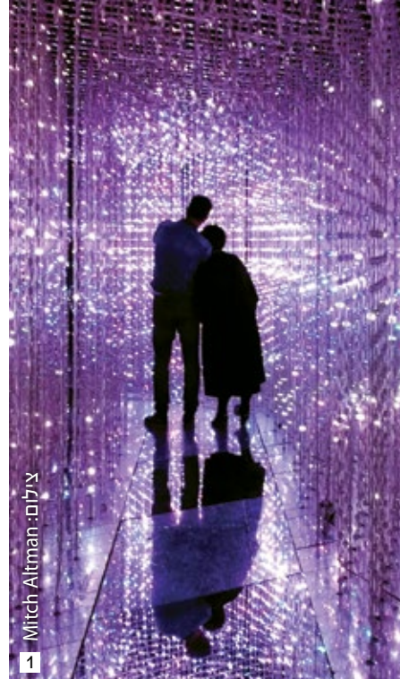
צילום: Mitch Altman 1

אלה הפכו את המקום למבוקש ביותר. המתחם גדול למדי, ויש בו מספר רב של כניסות. הדור הצעיר אוהב להגיע לכאן, והגיל הממוצע של המוני המבקרים לא עולה על 20. המתחם מציג ספקטרום רחב שנוע מגלריות מעוצבות ויוקרתיות ועד חנויות שמזכירות יותר שוק פשפשים, שלא לדבר על דוכנים מאולתרים שמציעים סחורה זולה. זוהי הסיבה לכך שחלק מהסחורות מוצעות על מצעים שמחוברים לאופניים או לרכב מנועי, והן נעלמות עם הגעת שוטרים או פקחים למקום. המתחם הוא מקום מצויץ לרכוש לעצמכם מזכרות, פריטי אומנות סינית עכשווית ומודרנית. יצירות האומנות שמודפסות כאן על ספלים, מחברות או עניבות שייכות לאומנים הסינים הכי מפורסמים. המתחם ממוקם ליד הכביש שמוליך ממרכז העיר לנמל התעופה, בקרבת הטבעת החמישית המרוחקת ממרכז העיר. קרבתו לנמל התעופה הופכת אותו לאתר שניתן לשלבו בדרך לנמל התעופה פייטל או ממנו.