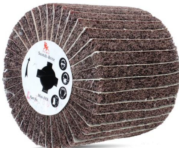
B100180 Size 4" Grit 180