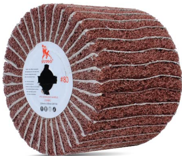
B100080 Size 4" Grit 80