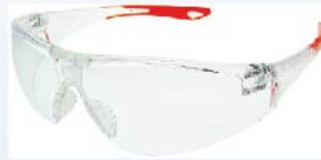
YS-811 เลนส์ใสปรอท (LENS CLEAR / MIRROR)