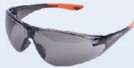
YS-820 เลนส์สีเทา (SMOKE)