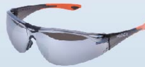
YS-821 เลนส์สีเทาปรอท (SMOKE / MIRROR)