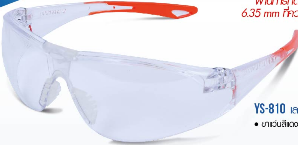
YS-810 เลนส์ใส (LENS CLEAR)

เลนส์ Polycarbonate รับแรงกระแทกได้ในระดับสูง (High Impact) ผ่านทดสอบด้วยลูกปืนขนาด 6.35 mm ที่ความเร็ว 45 m/s แล้วไม่ทะลุ