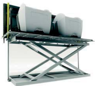
equipo en superficie, vista general