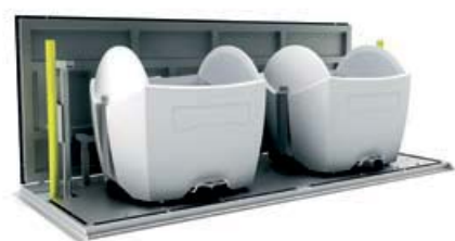
equipo en superficie, tapa abierta

El SIDETAINER cuenta con una capacidad para 1 o 2 contenedores soterrados (3200 / 4000 L). Situado en la superficie para su recogida, la plataforma tiene espacio suficiente para que el camión maniobre con el contenedor. Este sistema es compatible con los vehículos de carga lateral para la recogida de residuos, contruídos de acuerdo con la norma EN 1501-2.