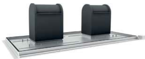
equipo con tapa cerrada

El modelo Citytainer está compuesto por una plataforma metálica única, capaz de alojar hasta 4 contenedores (siendo esta configuración ideal para reciclaje) de 3.000 o 5.000 L. Los contenedores son compatibles con grúas estándar, que estén en conformidad con la norma EN 13071-1. El CITYTAINER está realizado de acuerdo con la norma EN 13071-2.