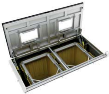
equipo con tapa abierta