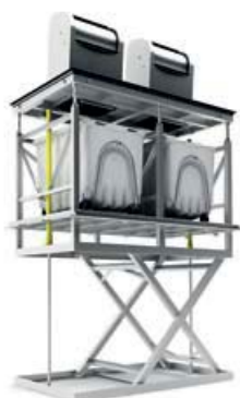
equipo en superficie, vista general