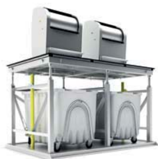
equipo en superficie, tapa cerrada

El ECOTAINER es capaz de albergar hasta 4 contenedores soterrados (800, 1100 y 1300 L) y disponerlos en la superficie para su recogida. La plataforma eleva los contenedores soterrados hasta la superficie para la recogida trasera de los vehículos de servicio.