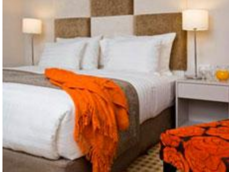
מלון שדות - מלון בוטיק לאנשי עסקים

נועה יחיאלי | mako | פורסם 02/08/09 17:58:52