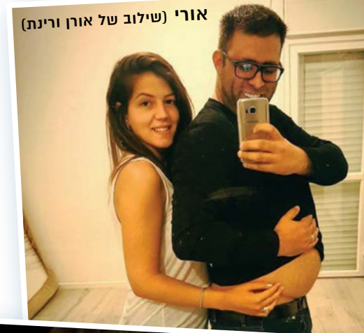
אורי (שילוב של אורן ורינת)