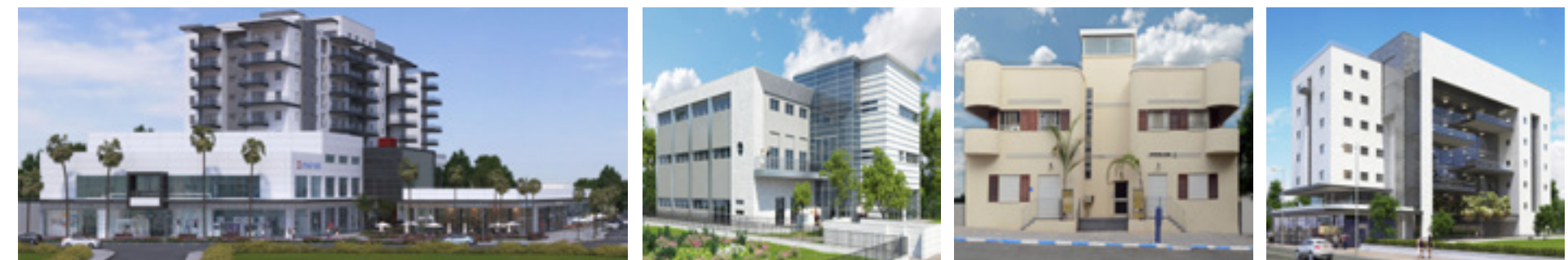
פרדס חנה - מרכזי קניות ובילוי