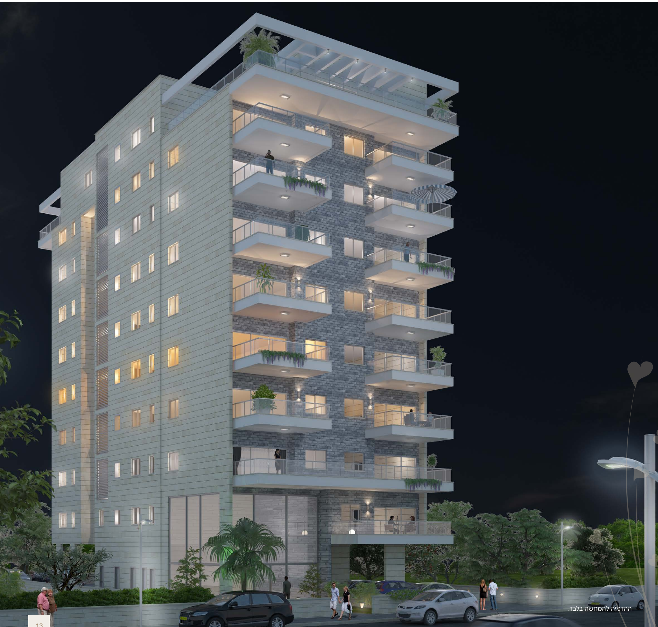
ההדמיה להמחשה בלבד.